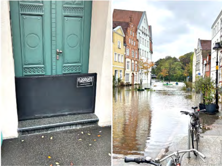
Flutschott am Ganghaus. Das Wasser steigt unaufhörlich.