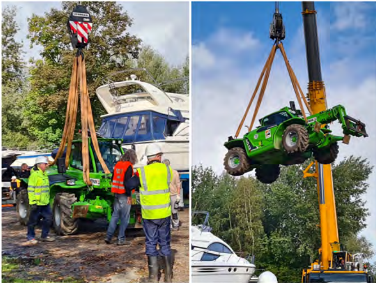
Fliegender Merlo - sicher einmalig!

Nach der Pause sollte es in den Endspurt gehen; viele Boote fehlten nicht mehr - ein Kinderspiel. Fast. Wenn der Merlo angesprungen wäre. Ist er aber nicht. Auch nach gutem Zureden, Überprüfen der Technik (soweit das vorhandene Know-how das zuließ), nichts half. Der Merlo wollte nicht mehr. Der technische Dienst hätte nach frühestens zwei Stunden vor Ort sein können. Unglücklicherweise stand der Merlo mitten im Weg, nämlich genau dort, wo das nächste Boot hätte abgestellt werden sollen. Da der Platz an Land im Winterlager immer sehr knapp ist, konnte er dort nicht stehen bleiben. Der zeitliche Vorsprung von Freitag war also dahin. Was die Slipkolonne sich dann überlegt hat, ist wahrscheinlich so noch nicht vorgekommen im LMC. Der Merlo steht im Weg, der Kran steht bereit - was liegt also näher, als den Merlo durch die Luft aus dem Weg zu schaffen? Richtig: nichts. Also wurde er kurzerhand an den Kran gehängt und so abgestellt, dass er nicht mehr störte und später abgeholt werden konnte. Dank des vereinseigenen Treckers konnten die letzten Boote auf ihren Trailern sicher auf den geplanten Winterliegeplatz geschoben werden.